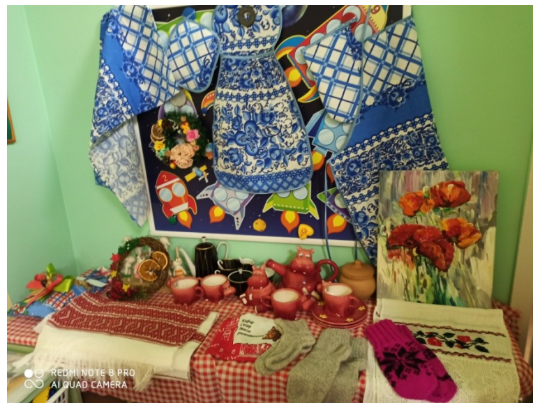
«Золотые ручки мамочки моей»