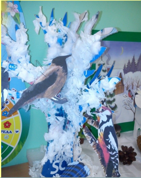
Изготовление зимнего дерева