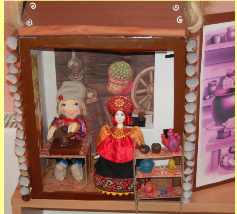
Мини- музей «Гончарная Лавка»