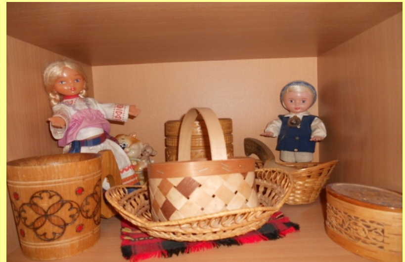
Мини – музей «Народные промыслы»