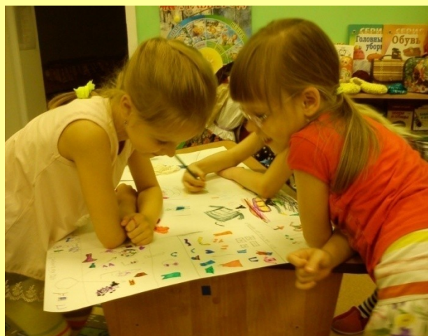
Планирование деятельности на неделю по технологии трех вопросов