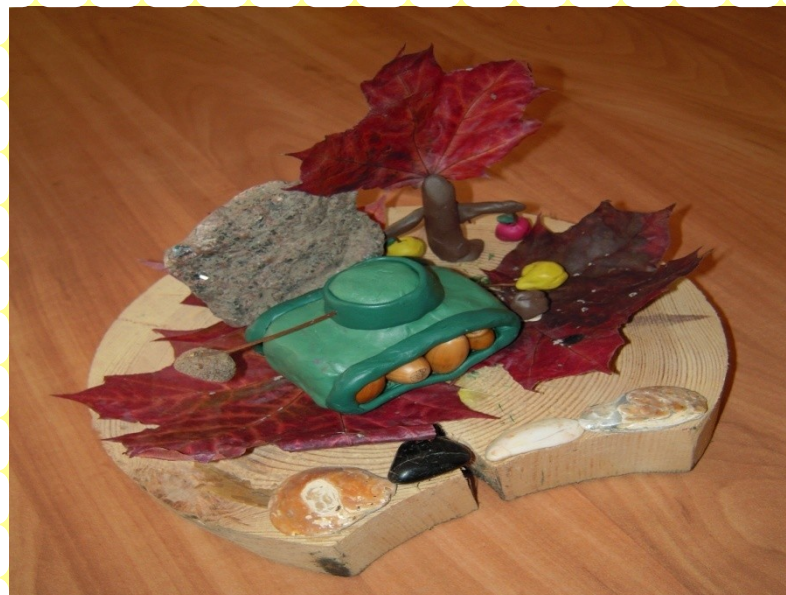
Макеты, поделки «Наш город»