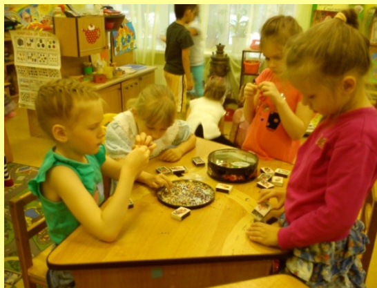
Бисероплетение в самостоятельной деятельности