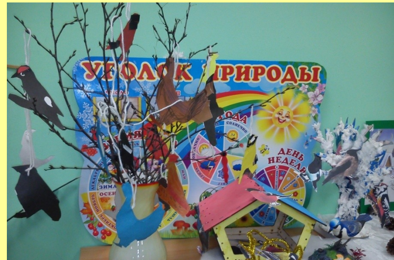
Конструирование и силуэтное вырезание «Зимующие птицы»