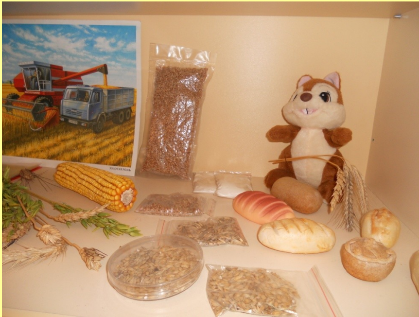
Мини – музей «Хлеб всему голова»