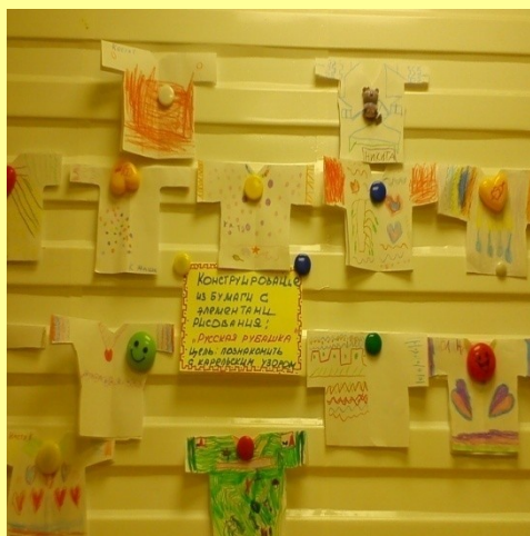
Конструирование из бумаги «Русская рубашка»