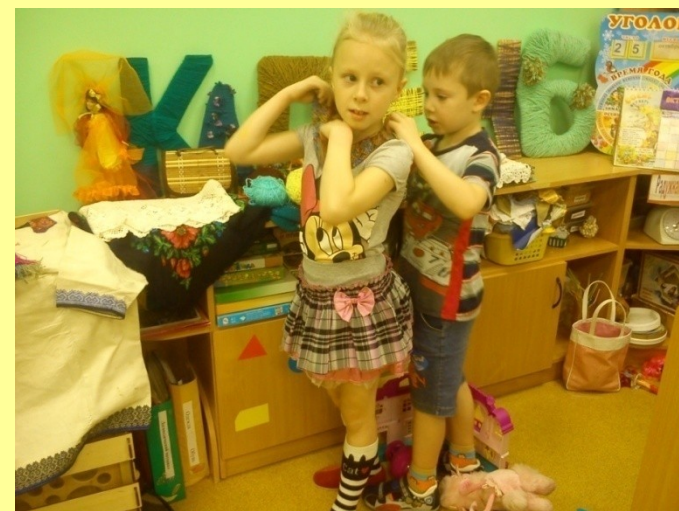
Мы играем в ателье