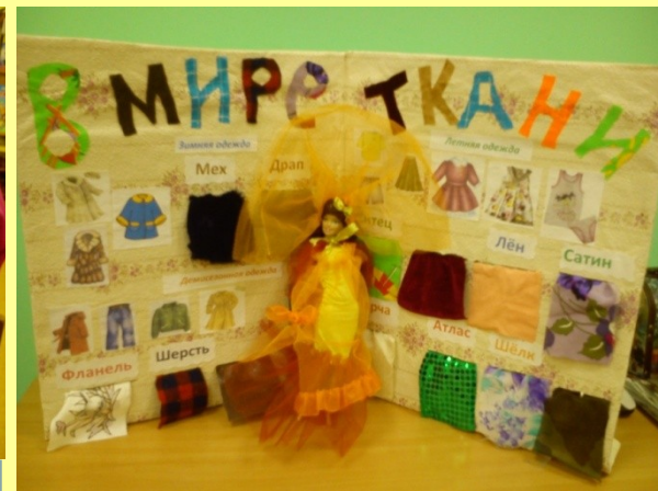
Витрина с тканями для ателье