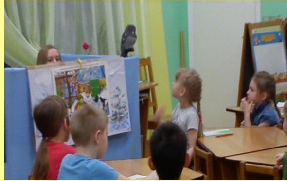
Разыгрывание диалогов по сказкам