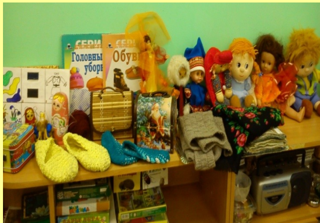
Минимусей «Бабушкин сундучок»