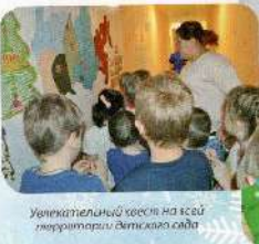
Увлекательный квест на всей территории детского сада