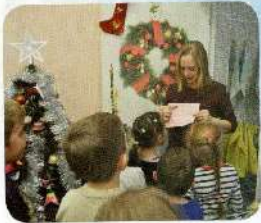
Задание от Деду Мороза привнесло рождественскую атмосферу в класс