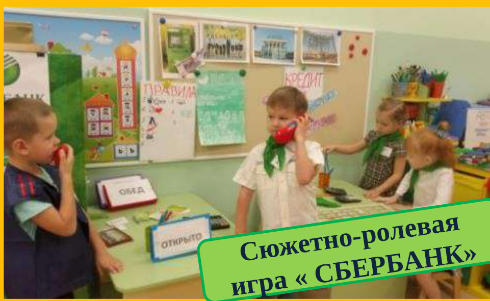
Сюжетно-ролевая игра «СБЕРБАНК»