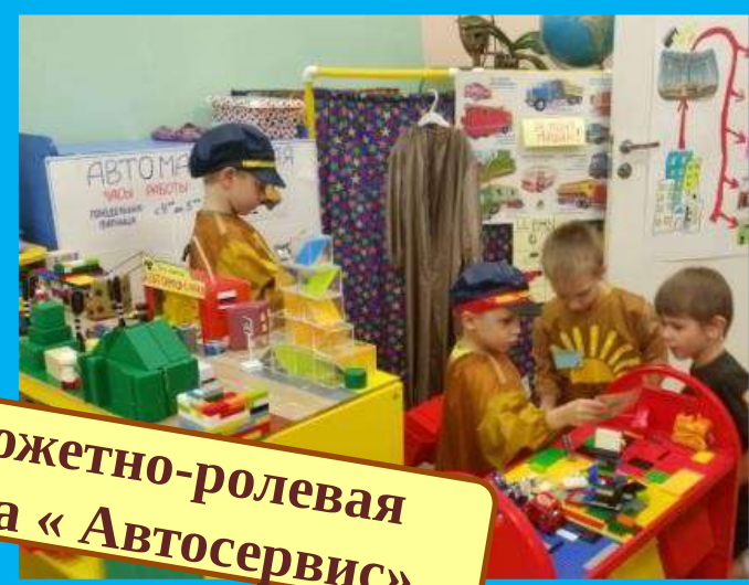
Сюжетно-ролевая игра «Автосервис»