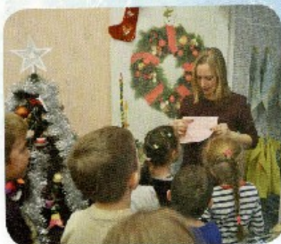
Задание от Деда Мороза – провести рождественскую неделю весело