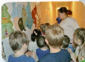
Увлекательный квест на всей территории детского сада

искали и встречали сказочных героев, находили конверты с указанной цифрой и выполняли разные задания. В итоге, после выполнения задания, дети завоевывали букву. Когда все этапы были пройдены, и все буквы собраны, дети складывали из букв имя того героя, кто прислал письмо, а герой, оказывается, приготовил подарки, которым все были несказанно рады.